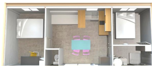
Variante, version 2 chambres